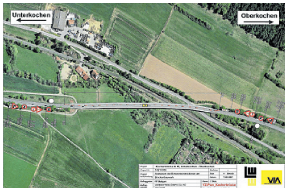
Lageplan – halbseitige Sperrung der B19, Kocherbrücke bei Unterkochen.