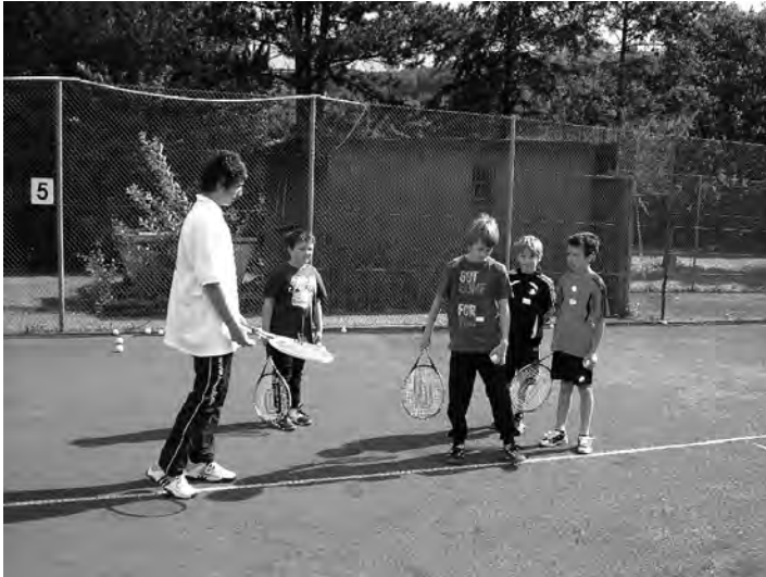
Auf der Tennisanlage

Viele Kinder und Jugendliche besuchten am Mittwoch die Tennisanlage. Zu Anfang gab es erst Übungen zur Ballgewöhnung, danach wurde aber auch Tennis gespielt. Hervorragende Voraussetzungen und einiges an Begabung sind bei den jungen Spielern bereits schon vorhanden. Die Leitung hatten die Betreuer des Tennisclubs übernommen.