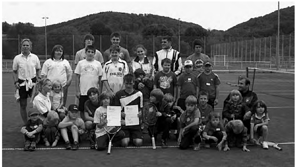
Auf dem Bild strahlen die Ferienprogrammteilnehmer mit den Betreuern vom TCO um die Wette