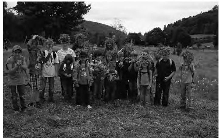
»Survival« Abenteuer für Kinder

Die Fam. Eyth hatte am Dienstag zu einem »Survival«- Abenteuer für Kinder eingeladen. Getarnt und lautlos schlichen die Kinder durch den Wald und bauten sich eine wasserdichte und kuschelige »Wohnhöhle«. Aus heimischen Pflanzen wurden stabile und coole Schnüre hergestellt. Die Kinder waren vollauf begeistert von dieser tollen Veranstaltung.