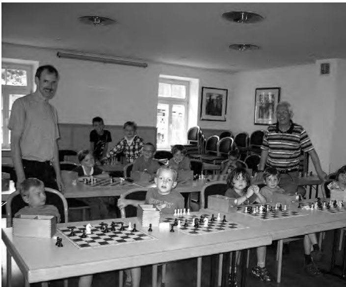
Schachspiel im Schillerhaus

Das Schachspiel begeisterte viele Kinder am Freitag . Im »Schillerhaus« konnte auf spielerische Weise Schach erlernt werden. Dafür wurde von den Mädchen und Jungen nicht nur das räumliche Denken, sondern vor allem Konzentration und ein geplantes Handeln gefordert. Diese Veranstaltung wurde gut angenommen und es wurde ein großes, ja langfristiges Interesse an diesem Spiel gezeigt. Die Leitung hatte der Schachverein übernommen.