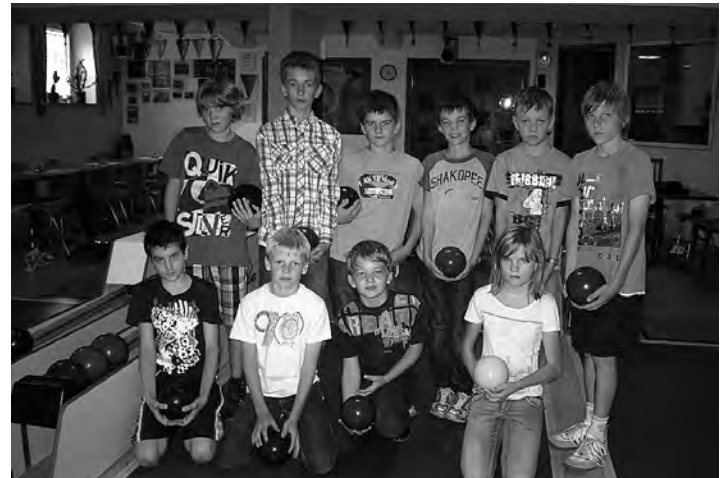
Kegeln auf den Kochertalbahnen

Am selben Nachmittag lud der Sportkegelclub zum Kegeln in dessen Kegelanlage »Kochertalbahnen« ein. Die Teilnehmer kegelten in kleineren Gruppen und waren voll bei der Sache, um diese schöne Sportart ausüben zu können. Es war ein lustiger Nachmittag mit jeder Menge Spaß.